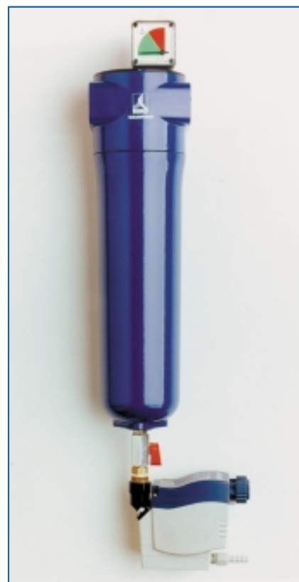
In den Clearpoint-Filtern verhindert eine Imprägnierung das Quellen des Filtermediums